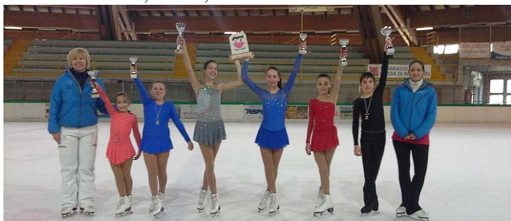
IL TEAM DI FIEMME ON ICE CHE HA VINTO IL TROFEO "PATTINI COL CUORE" CAVALESE 15 FEB. 2015